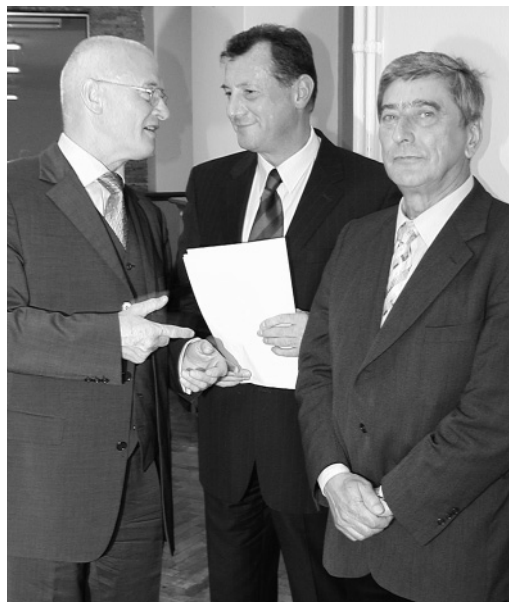
Präsident (Mi) und Vizepräsident (re) des LFB Brandenburg e.V. im Gespräch mit dem Landtagspräsidenten (li)

Das sogenannte Modernisierungsgesetz der Bundesregierung sieht im Gesundheitssektor die Beseitigung von Freiberuflichkeit vor. "Die Abschaffung der fachärztlichen Betreuung oder die Beseitigung der wohnortnahen, inhabergeführten Apotheke werden wir uns nicht bieten lassen", sagte der Mediziner. Er erinnerte die Landespolitiker an ihre Ver-